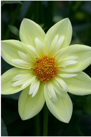
'Claire de Lune'