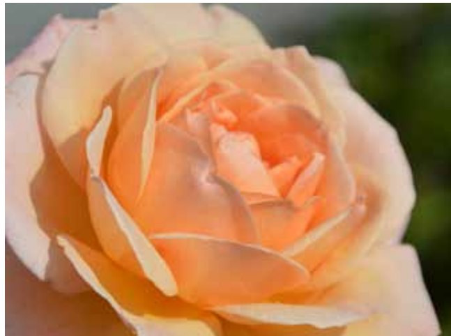
Rosa 'Großherzogin Luise'

Die Rose 'Großherzogin Luise' des Züchters W. Kordes' Söhne gehört nach Züchterangaben zur Parfuma-Kollektion des Hauses Kordes und bildet einen frischen, fruchtigen Duft aus Pfirsich und Aprikose. "Das tiefe und abgerundete Bouquet betört mit sahnigblütigen Aspekten, die an Magnolie oder Tuberose er-